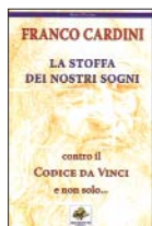
Franco Cardini La stoffa dei nostri sogni Sassoscritto Editore