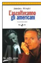
Amedeo Minghi L'ascolteranno gli Americani Rai Eri