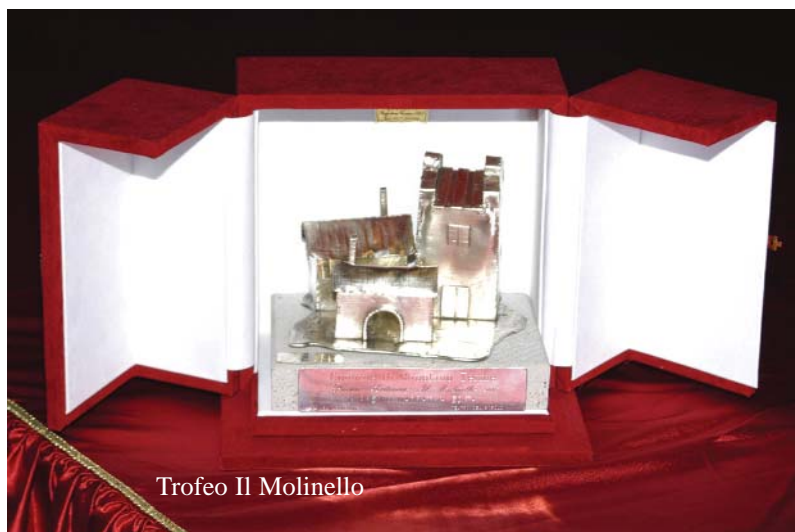
Trofeo Il Molinello