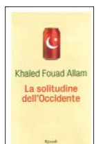
Khaled Fouad Allam La solitudine dell'Occidente Rizzoli