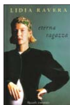
Lidia Ravera Eterna ragazza Rizzoli